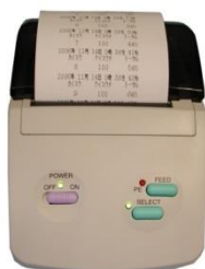
ジャーナルプリンター