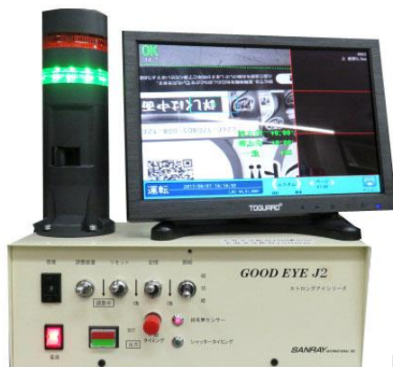
上カメラのみ検査

高機能 CMOS カメラで画像がクリア、RGB モニターは高視野角、高繊細画面 カメラはモノクロですが、メニューその他画面表示がカラーで見やすい 少ロット、多品種でも視野内に文字、対象物があれば記憶ボタンを押すだけでセット完了 位置ズレ感度を簡単にデジスイッチで切替可能 乱丁・ズレ・曲り等も検知可能 パトライトでタイミングの状態が見えます 照明の明るさは 2 段階切替可能、上カメラ 1,000mm の場合室内照明、下カメラ白色 LED 照明 オプションで絵柄カメラと表裏判別センサ同時使用可能