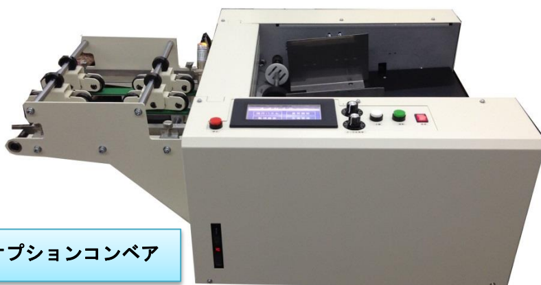
オプションコンベア

外部機器と接続してスタート・ストップが可能なので プリセットカウンターとして使用可能